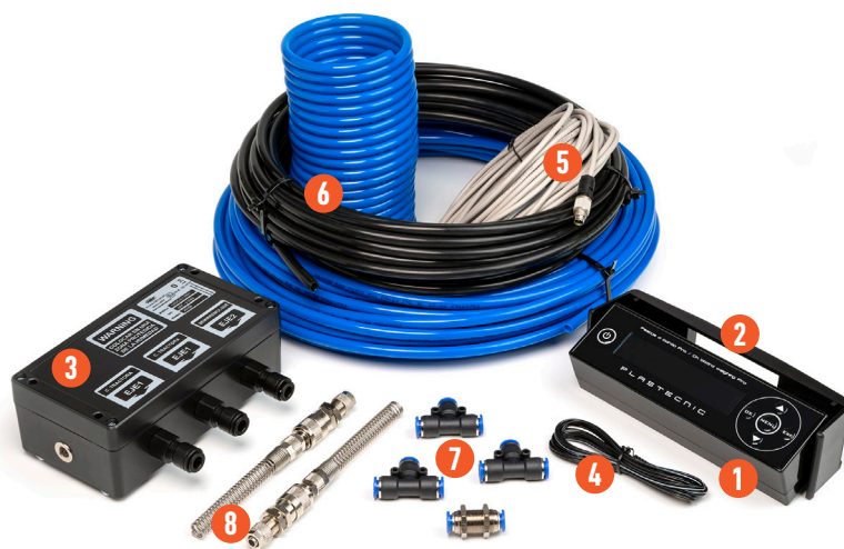
KIT DE INSTALACIÓN